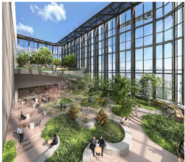
(27・28階 屋上テラス・ラウンジ)