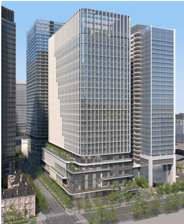
「MUFG本館」外観イメージ